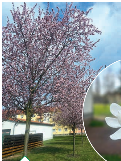
Magnolie in der Heinrich-Heine-Straße